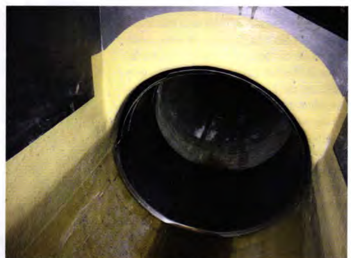
Die Abdichtung des Liners zu den GFK-Formteilen erfolgte mit Linerendmanschetten.