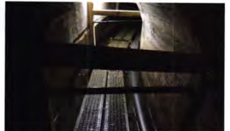
Um die Kräfte bei Einzug des Stützgewebes abzufangen, wurde der Sammler an den kritischen Stellen gegen das Gewölbe ausgesteift.

leff. Doch auch für ihn hielt die Maßnahme in Fulda besondere Herausforderungen bereit. Neben der auf den Anfang und das Ende der Sanierungsstrecke eingeschränkten Zugänglichkeit wurde im Vorfeld besonders der Einzug des Stützschlauches mit einer Winde über die große Länge und mit den Richtungsänderungen diskutiert. „Hierbei musste ein Verdrillen des Stützgewebes vermieden werden, denn dies hätte beim Inversieren zu einem Steckenbleiben des eigentlichen Schlauchliners führen können“, so Matthias Reimann. Um dieses Risiko zu minimieren, empfahl der Hersteller, den Stützschlauch mit einer zusätzlichen Außenkaschierung aus PE zu beschichten. Hierdurch erhöhte sich das Materialgewicht des Stützgewebes deutlich. Insofern wurde der Kanal im Vorfeld an den kritischen Stellen mit Stützen zum Gewölbe abgesteift, um die Einzugskräfte ableiten zu können, ohne den Kanal zu beschädigen.