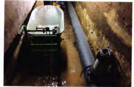
Wenig Platz und lange Wege: Für den Materialtransport wurde auch eine akkubetriebene Schubkarre eingesetzt. Rechts unten liegt das Druckrohr für die Abwasserüberleitung.