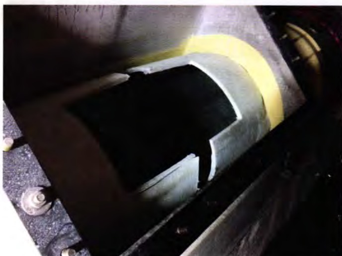
Um die Spannungen im Liner abzubauen, wurde der Liner im Abstand von etwa 90 Metern getrennt.