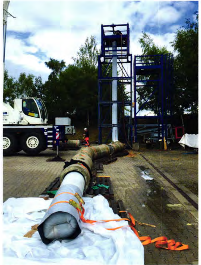
Zunächst war eine Testinstallation auf dem Gelände der Firma Aarsleff auszuführen.