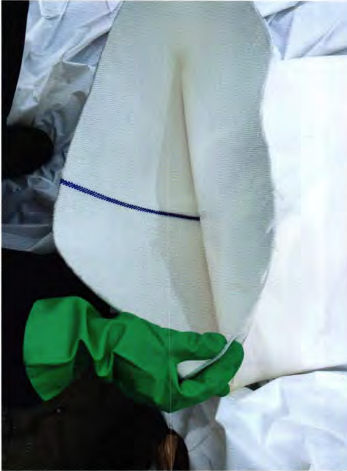
Das ausgewählte Stützgewebe des Herstellers Norditube kommt normalerweise bei der Sanierung von Druckrohrleitungen zum Einsatz.