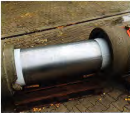
Bei dem Testeinbau stellte sich heraus, dass die Dehnung des Stützschlauches größer war, als in den Vorversuchen ermittelt.

kus Vogel vom Ingenieurbüro. Weiter zu berücksichtigen waren zwei gegenläufige Krümmungen im Profil. Diese Richtungsänderungen führen bei Linersystemen, die in den Kanal eingezogen werden, bei dem immensen Linergewicht und über die große Länge zu erhöhten Zugkräften. Eine detaillierte technische Analyse ergab, dass diese Kräfte bei einem Linereinzug vom Kanal nicht ins Gewölbe abgetragen werden können und den Sammler zerstört hätten. Wickelrohr- und andere Renovierungsvarianten schieden u.a. auf Grund der punktuellen Richtungsänderungen aus. Deshalb kam nur ein warmhärtendes Linersystem infrage, das den Schlauch mit Wasserdruck in den Kanal invertiert.