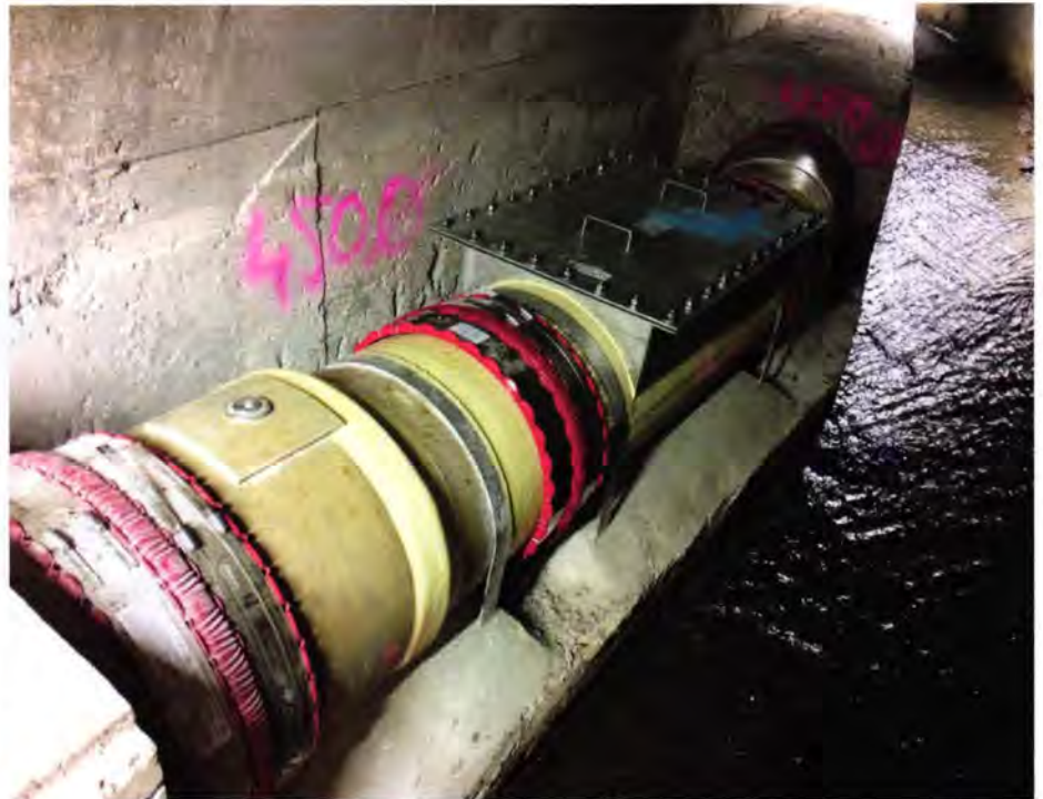
Auf der Sanierungsstrecke waren vor dem Linereinbau vier maßgefertigte GFK-Formteile einzubauen. Zu erkennen ist auch der Verpressstutzen für das später erfolgte Verdämmen des Liners.

Hinzu kam jedoch ein weiteres Problem: Die in dem Betonblock mit geringer Wanddicke und zumindest streckenweise niedriger Betonqualität gebetteten Steinzeugrohre waren nur in sehr geringem Maße in der Lage, Innendruck aufzunehmen. Der aufgrund der Höhenverhältnisse auftretende Wasserinnendruck von bis zu 1,2 bar hätte den Kanal bersten lassen.