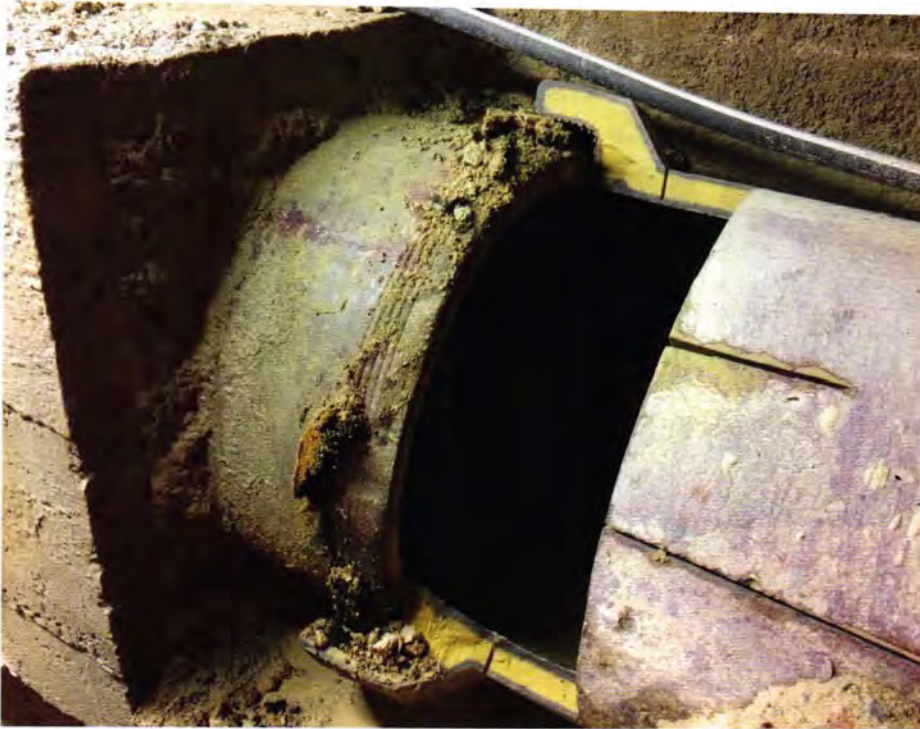
Beim Abbruch der Betonummantelung und dem Trennen der Steinzeugrohre war große Sorgfalt erforderlich.