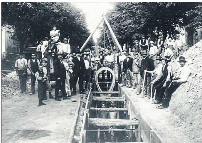
Anfang des 20. Jahrhunderts begann der systematische Ausbau der Abwasserentsorgung (hier eine Kanal-Baustelle 1903, vermutlich in Bahnhofsnähe).