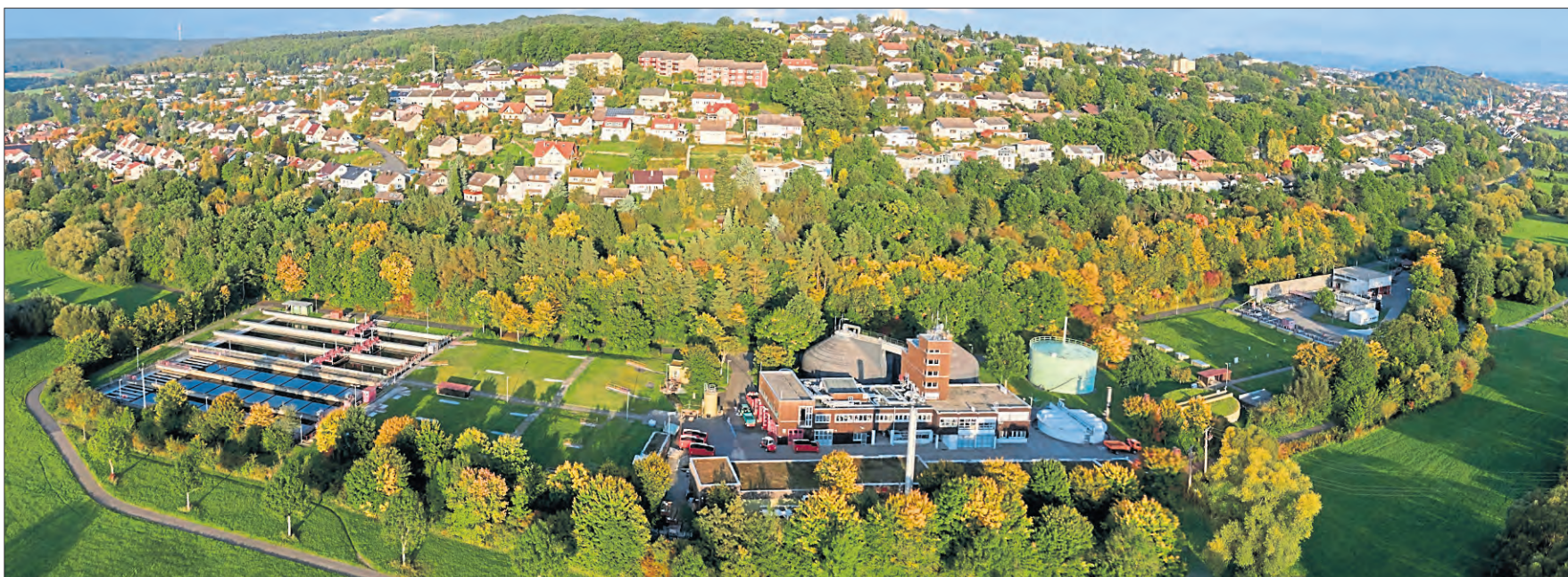
Heute ist die Kläranlage Fulda Gläserzell die zweitgrößte ihrer Art im Regierungsbezirk Kassel.